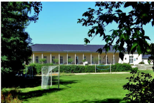
Früher das Aero-Club-Haus, 1936 fertiggestellt; ehem. Flugschule u. Bückler-Flugzeugbau-Werke am ehem. Flugplatz Rangsdorf, heute eine Privatschule.