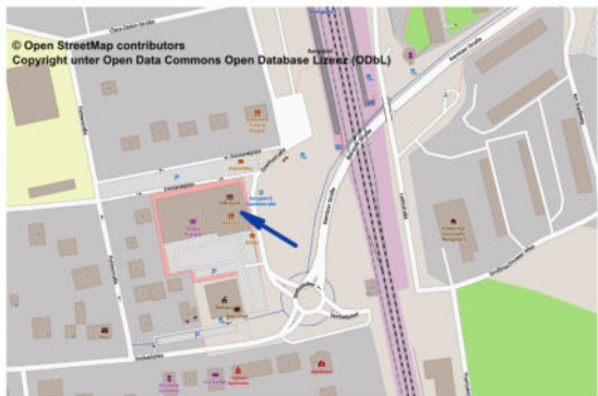
Lageplan für das Start-/Ziellokal, siehe Pfeilspitze.