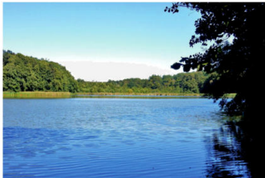
Der Rangsdorfer See

Bei der Überquerung bzw. der Benutzung von Straßen ist die StVO zu beachten. Tiere sind an der Leine zu führen. Rauchen ist im Wald verboten. Bei Schnee und Eis werden die Wanderwege nicht gestreut oder geräumt.