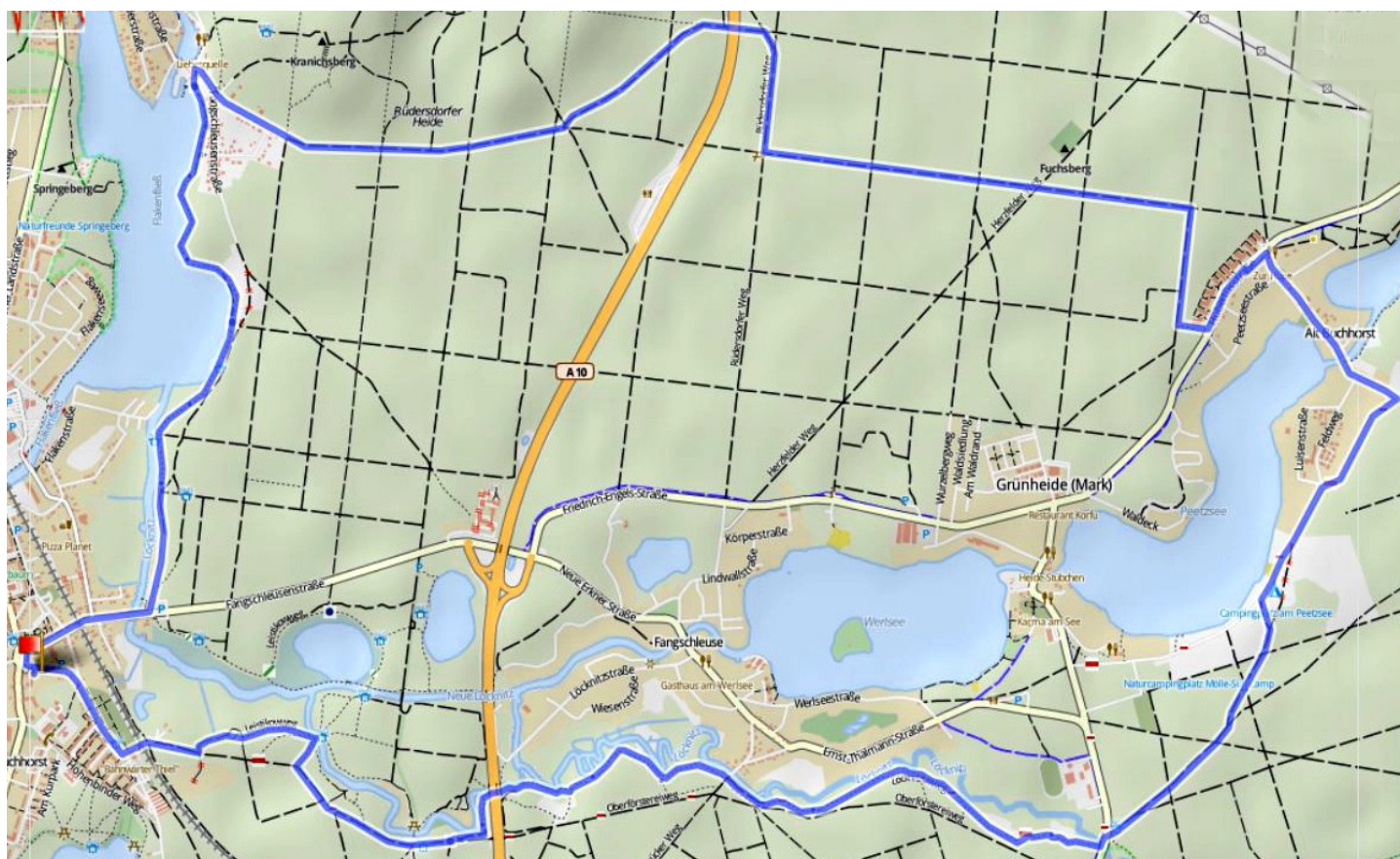
20 km Strecke