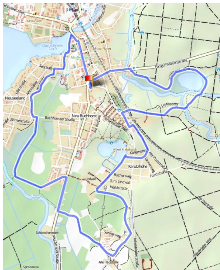
12 km Strecke