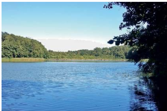
Der Rangsdorfer See

Bei der Überquerung bzw. der Benutzung von Straßen ist die StVO zu beachten. Tiere sind an der Leine zu führen. Rauchen ist im Wald verboten. Bei Schnee und Eis werden die Wanderwege nicht gestreut oder geräumt.