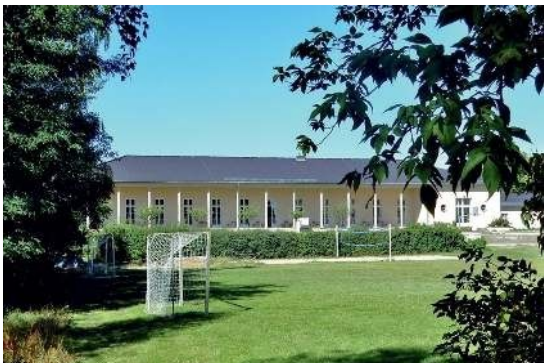
Früher das Aero-Club-Haus, 1936 fertiggestellt; ehem. Flugschule u. Bucker-Flugzeugbau-Werke am ehem. Flugplatz Rangsdorf, heute eine Privatschule.