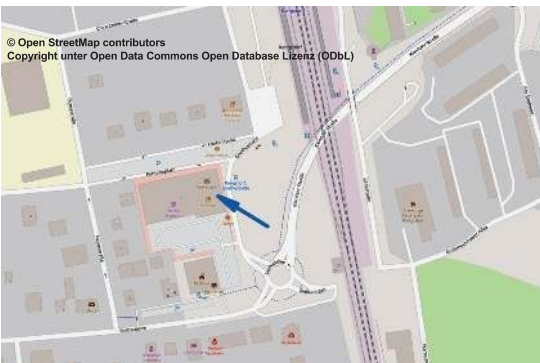
Lageplan für das Start-/Ziellokal, siehe Pfeilspitze.