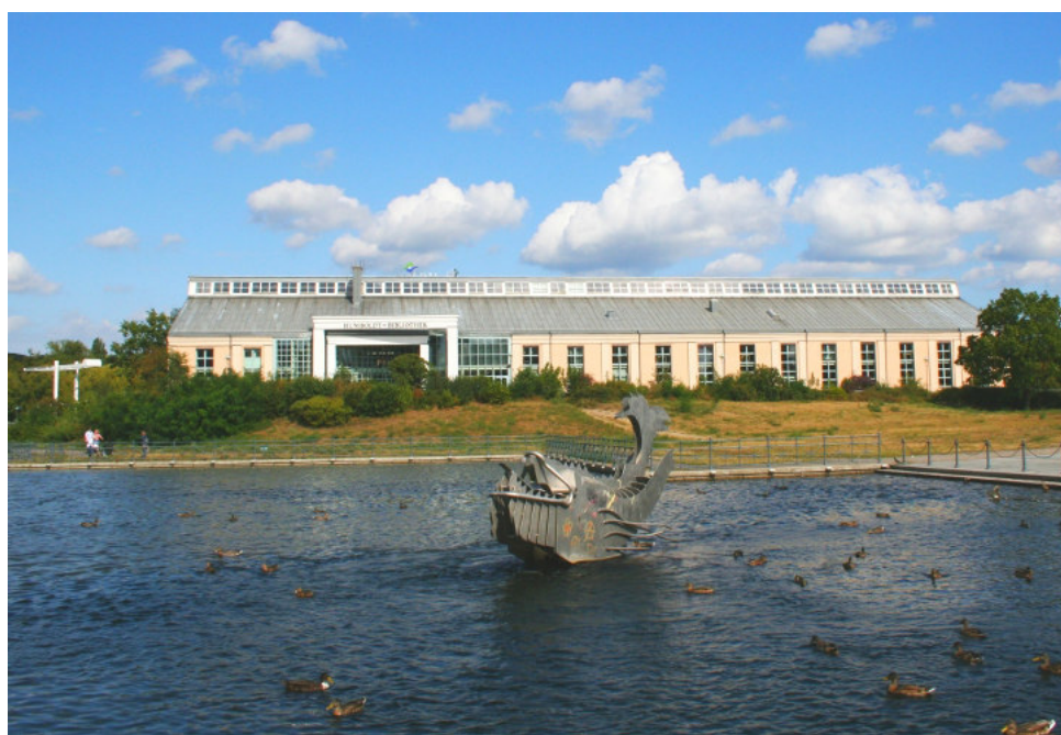
Humboldt - Bibliothek ( Tegel )